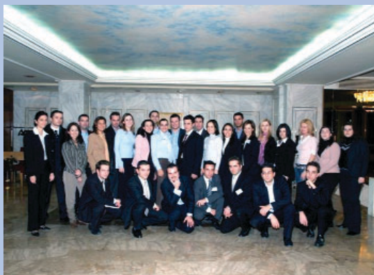
Αναμνηστική φωτογραφία από Induction Seminar

καθώς απαιτεί τη δέσμευση ανθρώπινων πόρων (εκπαιδευτών και συμμετεχόντων) για μακρύ χρονικό διάστημα, ή ακόμη λόγω της δύσκολης οργάνωσης και συντονισμού του. Επίσης σίγουρα αυτά που διδάσκονται οι νέοι συναδέλφοι δεν θα τα χρησιμοποιήσουν «τη Δευτέρα στο γραφείο», άρα είναι δυσκολότερο για εμάς τους υπεύθυνους εκπαίδευσης να αποδείξουμε την αξία ενός τέτοιου προγράμματος σε σχέση με ένα τεχνικό ή προϊόντικό σεμινάριο. Ωστόσο, τα υψηλά επίπεδα επαγγελματισμού, η αφοσίωση σε έναν οργανισμό και η υπερηφάνεια του να είναι κανείς μέρος του, αποτελούν το θετικό φορτίο που μεταφέρεται στους συναδέλφους που παρακολουθούν το Induction Seminar και είναι κοινώς αποδεκτό ότι τα στοιχεία αυτά είναι εξαιρετικά πολύτιμα.