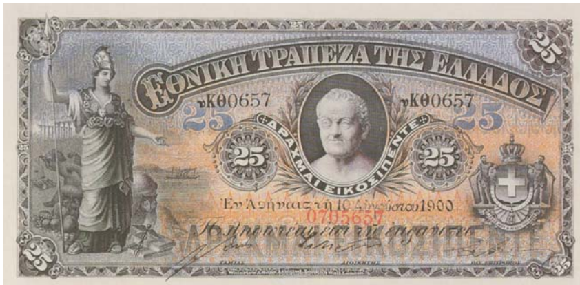
Τραπεζογραμμάτιο 25 δραχμών της ΕΤΕ (1900). Ενδιαφέρον παρουσιάζουν τα υπερβολικά κλασικίζοντα μοτίβα.