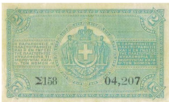
Κερματικά γραμμάρια των 2 δραχμών, εκδόσεως 1885.