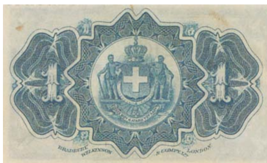
Κερματικά γραμμάτια της 1 δραχμής, Β' εκδόσεως (1897). Υιοθετείται η προτομή της Αθηνάς.

χρεωλυτικό σε διαρκές, καθώς τα 14.000.000 θα έμεναν αμείωτα στην κυκλοφορία έως την τελική εξόφλησή του (12) .