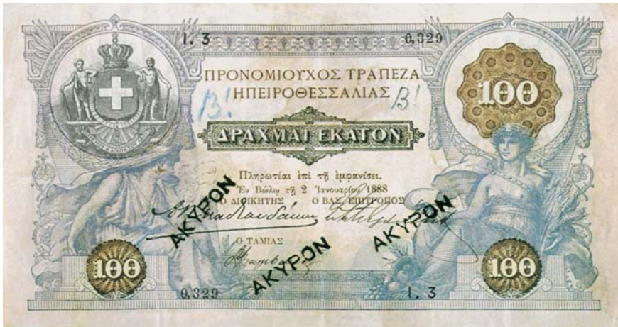
Τραπεζογραμμάτιο 100 δραχμών της Προνομίουχου Τράπεζας Ηπειροθεσσαλίας (1888)