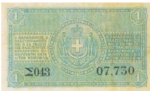
Κερματικά γραμμάτια της 1 δραχμής, εκδόσεως 1885.