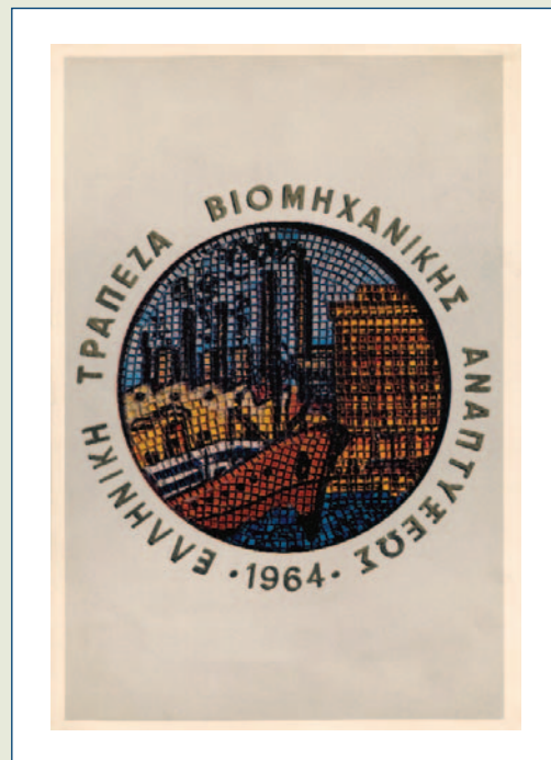
Αφίσα με το πρώτο σήμα της ΕΤΒΑ.

Το Ίδρυμα λειτουργεί από το 1986 και αποτελεί τη συνέχεια του Πολιτιστικού Τεχνολογικού Ιδρύματος ΕΤΒΑ (ΠΤΙ.ΕΤΒΑ) μετά την εξαγορά και συγχώνευση της ΕΤΒΑbank από την Τράπεζα Πειραιώς. Στη διάρκεια της εικοσαετούς πορείας του, το Ίδρυμα έχει σημαντική παρουσία στην έρευνα και προβολή του πολιτισμού της χώρας μας, με την ίδρυση και λειτουργία θεματικών τεχνολογικών μουσείων, τις εκδόσεις, την οργάνωση ερευνητικών προγραμμάτων και επιστημονικών εκδηλώσεων και τα τελευταία χρόνια με την αξιοποίηση του ιστορικού αρχείου της Τράπεζας. Οι δραστηριότητες του Π.Ι.Ο.Π. εγγράφονται στο πλαίσιο της κοινωνικής ευθύνης και προσφοράς της Τράπεζας Πειραιώς στον πολιτισμό, την έρευνα και την παιδεία, και το σημα-