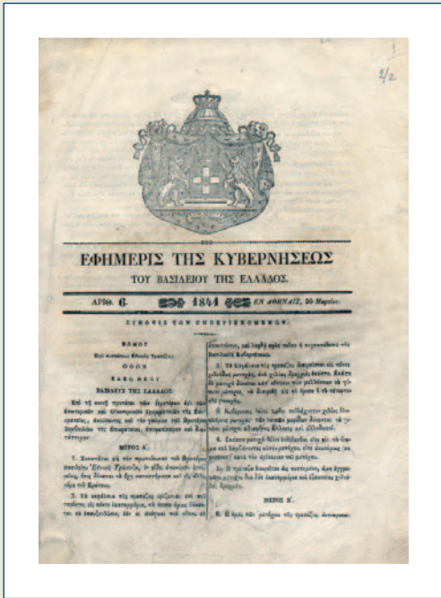
Η πρώτη σελίδα του δημοσιευμένου στην εφημερίδα της Κυβερνήσεως νόμου «περί συστάσεως Εθνικής Τραπέζης», φύλλο αριθ. 6 της 30ής Μαρτίου 1841.

λογές που έχουν αποτελέσει τη βάση για εκθεσιακές και εκπαιδευτικές δραστηριότητες για μαθητές σχολείων όλων των βαθμίδων, με προσέλευση 3.500 μαθητών κατά τη σχολική περίοδο του 2005.