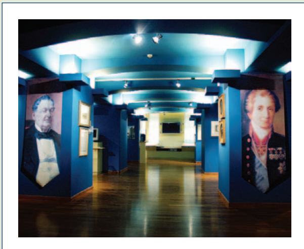
Άποψη του Μόνιμου Εκθετηρίου του ΙΑ/ΕΤΕ.

από τον πρωθυπουργό κ. Κώστα Καραμανλή μεγάλη περιοδική έκθεση με τίτλο: «Ιστορία του ελληνικού χαρτονομίσματος, 1822-2002» η οποία λειτουργεί ακόμη.