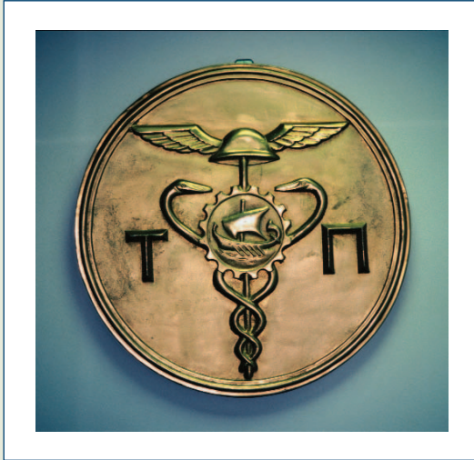
Το πρώτο έμβλημα της Τράπεζας Πειραιώς.

Το έργο της διάσωσης και οργάνωσης των ιστορικών αρχείων της Τράπεζας Πειραιώς και του Ομίλου της εντάσσεται στους καταστατικούς σκοπούς του Πολιτιστικού Ιδρύματος Ομίλου Πειραιώς (Π.Ι.Ο.Π).