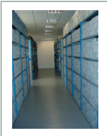
Όψη αρχειοστασίου της Alpha Bank.

Το Ιστορικό Αρχείο της Alpha Bank απαρτίζεται από διαφορετικά υποστρώματα υλικού. Εκτός από τα γραπτά τεκμήρια-έγγραφα και τα σταχωμένα κατάστιχα, τα οποία καταλαμβάνουν και τη μεγαλύτερη έκταση, υπάρχει επίσης αξιόλογο εικονογραφικό υλικό, ενώ έχουν διασωθεί σημαντικά οπτικοακουστικά τεκμήρια, τα οποία αφορούν κυρίως ηχητικές εγγραφές των Γενικών Συνελεύσεων των μετόχων.