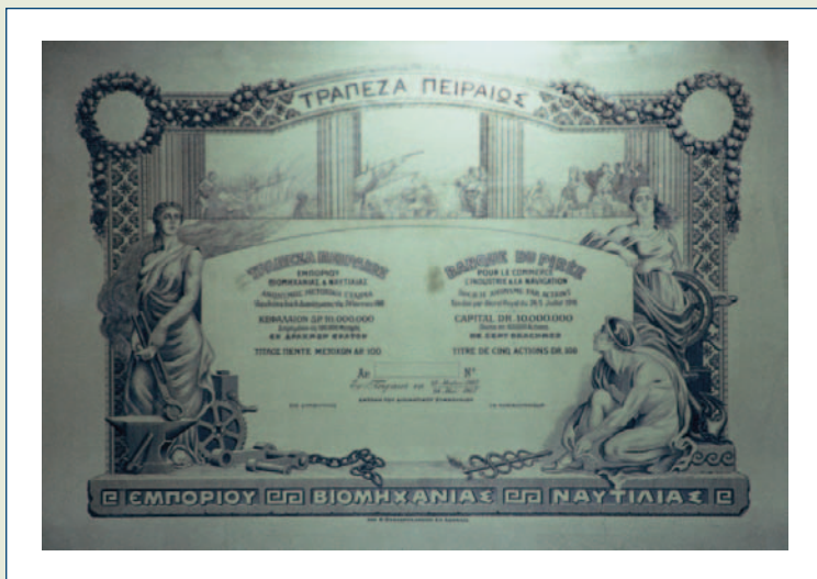
Λιθογραφική πλάκα μετοχών Τραπέζης Πειραιώς.

Οργανισμού Χρηματοδότησεως Οικονομικής Αναπτύξεως, Οργανισμού Βιομηχανικής Αναπτύξεως), οι οποίοι λειτούργησαν ως σημαντικοί φορείς χρηματοδότησης της ανάπτυξης –βιομηχανικής, μεταλλευτικής, ναυτιλιακής, τουριστικής– της Ελλάδας, αλλά και ως κύριοι φορείς άσκησης της οικονομικής πολιτικής του κράτους κατά τη μεταπολεμική περίοδο.