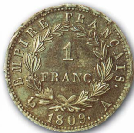
Το φράγκο του Ναπολέοντα Ι ακολουθεί το νομισματικό σύστημα που εισήχθη το 1803 από την επαναστατική Υπατία.

Για την αντιμετώπιση της ανισορροπίας, συγκαλείται το Νοέμβριο του 1865 από τον Ναπολέοντα ΙΙΙ, και μετά από πρόταση του Βελγίου, η Σύσκεψη των Παρισίων. Συμμετέχουν, εκτός από τη Γαλλία, η Ιταλία, η Ελβετία και το Βέλγιο. Παρόλο που οι τρεις χώρες προτιμούσαν την εφαρμογή του χρυσού κανόνα, η Γαλλία – επιδιώκοντας τη διατήρηση του νομισματικού της status quo – επέβαλε το διμεταλλισμό (16) και απεκατέστησε τη ratio 1 : 15,5. Υπογράφεται η ιδρυτική Σύμβαση της Λατινικής Νομισματικής Ένωσης με κύριο στόχο τη διασφάλιση της απόλυτης ομοιογένειας των νομισμάτων που θα κόβονται από τις χώρες-μέλη και, επομένως, τη θεσμική κατοχύρωση της αξίας τους (17) . Η θέσπιση μιας κοινής νομισματικής ζώνης επιτυγχάνεται όχι με την καθιέρωση ενός κοινού νομίσματος, αλλά με τη θέσπιση νομισματικού συστή-