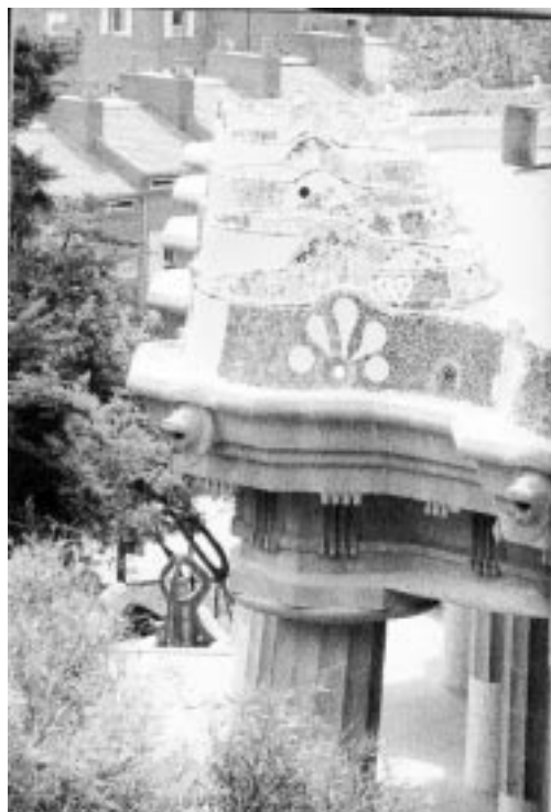
Η κεντρική πλατεία

Καθώς οι αρχιτεκτονικές φόρμες καταγράφουν τους διαφορετικούς κοινωνικούς χρόνους, η σχέση που εντοπίζεται ανάμεσα στην αστική ανάπτυξη, την κυκλοφορία του χρήματος και τη σημειολογική της έκφανση βρίσκει την πιο ολοκληρωμένη της έκφραση στα τραπεζικά κτίρια: πρόκειται για το ελκυστικό ερευνητικό πεδίο της αρχιτεκτονικής των τραπεζών. Η χωροθέτηση της τράπεζας στο αστικό περιβάλλον, η άμεση παρουσία της στο κέντρο της χρηματοοικονομικής δραστηριότητας απεικάζει όχι μόνο τη δυναμική του οργανισμού αλλά και τη συμβολή του στην οικονομική ζωή της πόλης. Η αρχιτεκτονική των κτηρίων του κάθε πιστωτικού ιδρύματος αποτελεί και τη σημειολογία του. Σημείο άλλοτε αφθονίας, άλλοτε μετριοπάθειας στη διαχείριση των κεφαλαίων, η εξωτερική εικόνα που η κάθε τράπεζα ενδύεται μοιάζει να πιστοποιεί την παντοδυναμία των οικονομικών θεσμών και να αιτιολογεί την επιζητούμενη εμπιστοσύνη. Για παράδειγμα, η υιοθέτηση των αρχιτεκτονικών νεωτερισμών της δεκαετίας του είκοσι, η χρήση δηλαδή του σιδήρου και των εκτεταμένων υάλινων επιφανειών στις προσόψεις των τραπεζικών κτηρίων, κρυσταλλώνουν την ασφάλεια στη διαχείριση των λαϊκών αποταμιεύσεων και τη διαφάνεια που η τράπεζα εγγυάται (13) . Από την άλλη πλευρά, η τραπεζική αρχιτεκτονική, το έλασσον αυτό πεδίο της οικονομικής ιστο-