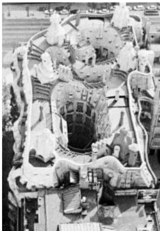
Κάτοψη της Casa Milà

της αρχικής ταυτότητας της κατασκευής. Το όλο εγχείρημα συνδυάστηκε με την ευφυή χρήση του μεγάρου, το οποίο πλέον μπορεί να χαρακτηριστεί ως ένα κτήριο πολλαπλών χρήσεων: εγκατάσταση υποκαταστήματος της Τράπεζας της Καταλωνίας σε μια από τις προσόψεις, στέγαση του Μορφωτικού της Ιδρύματος, εκθεσιακός χώρος, μουσείο Gaudí κλπ. Η τράπεζα, λοιπόν, αναλαμβάνοντας το ρόλο του μαϊκίνα, εστίασε στη λειτουργικότητα της πρότασης, ενώ επέλεξε για την ίδια την πλέον διακριτική παρουσία, ούτως ώστε να μην υποσκάπτεται η ταυτότητα του κτηρίου. Το συγκεκριμένο εγχείρημα αποτελεί πρότυπο επιτυχούς συνομιλίας του πιστωτικού οργανισμού με την ίδια την πόλη. Ανακαινίζοντας και αξιοποιώντας ένα κομμάτι από το αστικό παρελθόν, η τράπεζα αποκτά ρίζες, αποκαθιστά μια μη αναιρούμενη επικοινωνία με την τοπική παράδοση, ενώ παράλληλα ενισχύει τόσο την πολιτιστική της διάσταση όσο και τον οικονομικό της ρόλο, καθώς ενδύεται τη δυναμική του χώρου. Ας σταθούμε όμως για