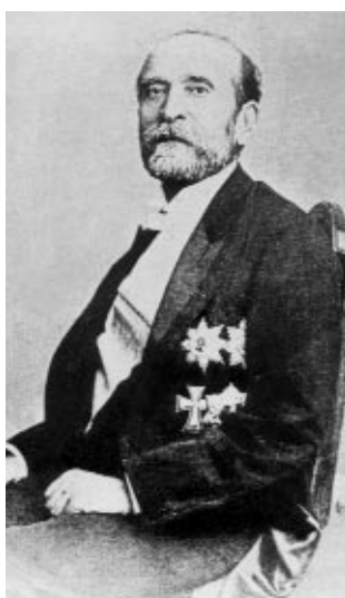
Ανδρέας Κ. Συγγρός (1823-1899)

B. “... φρόντισε ν’ ανοίξῃς πόρταν πλουσίου τινος Ἰεβραίου δια να κάμνῃς ἀργασίας χρηματιστικὰς μαζί του καὶ ὄφεις τοῖς Ἕλληνας να παραδέχωνται μὴ τα δῆθεν ἀμπορικὰ των...”**