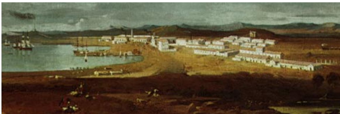
Γενική άποψη Λαυρίου.

Εάν οι πηγές δίνουν πληροφορίες που επιτρέπουν τη σήμανση των λέξεων οι οποίες στη διαχρονική τους πορεία έχουν εννοιολογηθεί διαφορετικά (36) , η ίδια σημασιολογική μεταφορά διαθλάττει και επί των οικονομικών φαινομένων. Σταχυολογώντας σημεία-τομές στην οικονομική δραστηριότητα των ομογενών, παρατηρήσαμε με ποιο τρόπο οι ομόκεντροι κύκλοι αρχίζουν σιγά σιγά να εστιάζουν στην ελληνική πρωτεύουσα. Καθώς η πολύμορφη δράση της Διασποράς τη φέρνει κοντά στους χρηματοοικονομικούς θεσμούς της Ευρώπης, πρισματικά αποτυπώνεται η αντίστροφη πορεία προς τη μετάγγιση των οικονομικών επιφαινομένων στην ελληνική επικράτεια. Εφ' όσον η ιστορία μπορεί να ανατρέχει στα λιγότερο εκκωφαντικά γεγονότα, αυτά που ξετυλίγονται σταδιακά και με ταπεινότητα στο χρόνο (37) , η διαπραγμάτευση του μηχανισμού της οικονομίας παραπέμπει και σε άλλες, πέραν από ποσοτικές, μαρτυρίες.