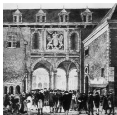
Το κτίριο της “μπούρσας” του Αμστερνταμ – Νέα Ελληνική Βιβλιοθήκη).