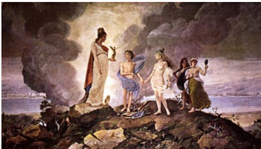
Αλληγορία : η Αθηνά και τα αγαθά της μεταλλευτικής – κτίριο ΑΤΕ, πρόην Σερπιέση. (Από την Έκδοση της ΑΤΕ, το Αρχοντικό της Αγροτικής Τράπεζας).

“πούλα-αγόραζε” του φθίνοντος 19ου αιώνα. Κι αν στην αρχή ο απόηχος των ανθρωπίνων πράξεων είναι εγκωμιαστικός για τη φιλαντία της λαυριακής μετοχής, γρήγορα θα αισθανθεί την απαξίωση και τον εξευτελισμό της. Αφού αποχωρισθεί τα αστικά σπίτια των πρώτων κατόχων της, θα βρεθεί να αλλάζει χέρια σε ύποπτα καταγώγια για να καταλήξει στο “Καφενεῖον” TM Ἄωραία Ἄελλας ”, όπου (γωνία Ερμού και Αιόλου) λειτουργεί το πρώτο Χρηματιστήριο. Σταματάμε για λίγο στο ιστορικό καφενεῖο, για να αναλογιστούμε έναν παραλληλισμό: η λειτουργία του λονδρεζικου χρηματιστηρίου στα καφέ της οδού Alley κατά τον 17ο και 18ο αιώνα και οι πρώτες “συνεδρίες” στην Ωραία Ελλάδα εγγράφονται σε μια κανονικότητα της ιστορίας ή αποτελούν άραγε έναν κοινότοπο μηχανισμό άμυνας μοροστά σε μια οικονομική δραστηριό-